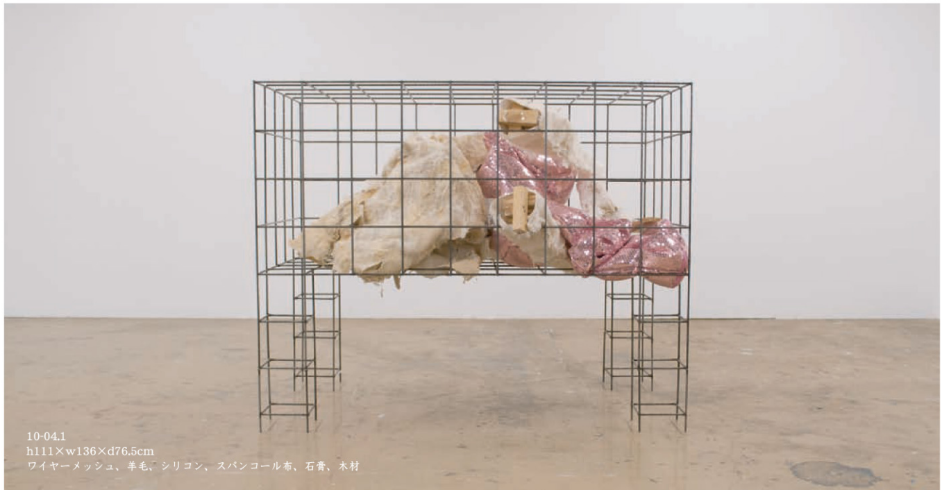
10-04.1 h111×w136×d76.5cm ワイヤーメッシュ、羊毛、シリコン、スパンコール布、石膏、木材