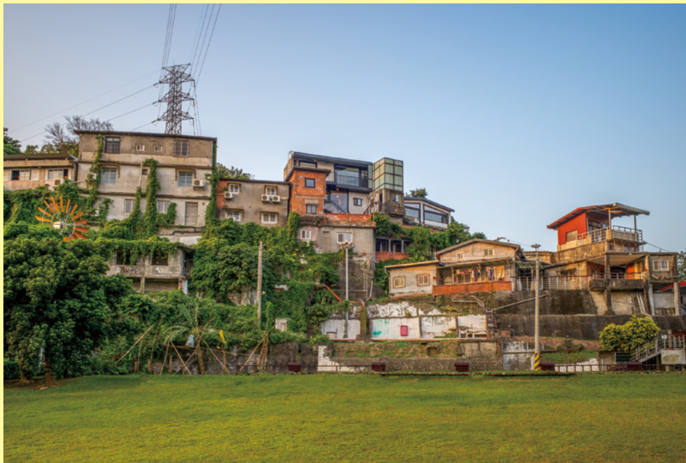
台北トレジャーヒルアーティスト村