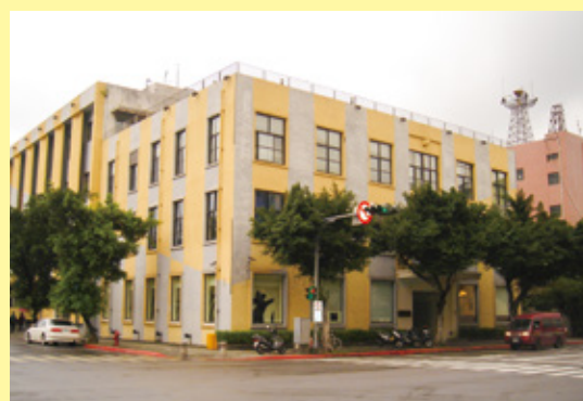
TAIPEI ARTIST VILLAGE 台北國際藝術村