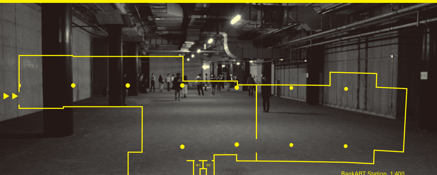
BankART Station 1:400

『BankART1929は駅でありたいと考えている。ヨーロッパの駅のように様々な人々が行きかい、コーヒーやビールを飲み、ベンチで眠っている人、たまにはケンカをする人、自由に音楽を奏でる人がいる、そんな包容力のある心地よく過ごせる空間を目指していきたい。また横浜は貿易の街。人が集まり、アーティストが育ち、物が動き、情報が行きかい、経済が動く、交易の場所。何か表現する人も、それをサポートする人もそれで食べていけるような経済構造へと共に変換していきたい。BankARTはそのための実験の場所でありたいと考えている。』