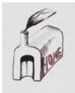
SWEET HOME, 2006