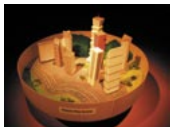
SHAKE YOUR ASS!, 2005