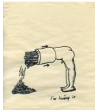
BURGER MAN, 2005