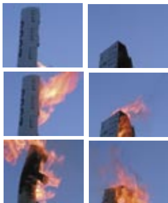
BURNING BUILDINGS, 2005