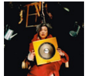
宝は闇 / LOVE IS BLIND

本講座では、演劇カンパニーARICAを構成する8人のメンバーが、ARICAと自身のふだ