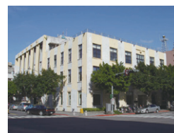
Taipei Artist Village

アーツコミッション・ヨコハマ（横浜市開港150周年・創造都市事業本部、財団法人横浜市芸術文化振興財団）