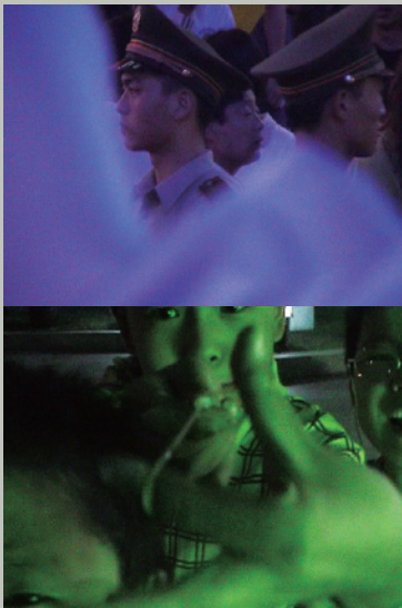
Still images from video: Shot Through (2008)