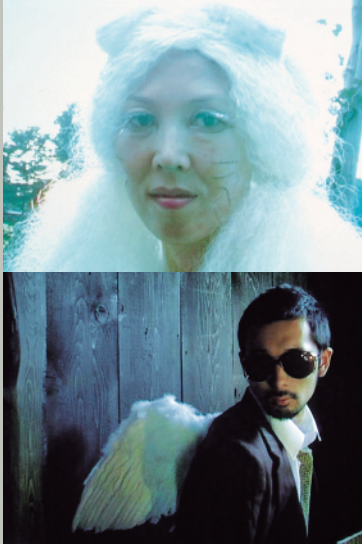
Still images from video: Restaurant Wild Cat House (2007) L'Amour (2007)

Continuing her interest in approaching each new work as a new encounter with location, situation, people and expectations, Erika starts her project with the an eclectic range of references: an 1860's British Admiralty map of Edo Bay and its Japanese equivalent; an anthropological account of Japanese society titled: Through the Looking Glass and Roland Barthe's fantastical Empire of Signs. Just as Ibn Battuta's journal A Gift to Those Who Contemplate the Wonders of Cities and the Marvels of Travelling, becomes more of a fiction then a factual account of his 13th century travels, Erika will explore the merging of the observational and the choreographed in a series of videos and photographs. As part of her project here, Erika is making a video work of Yokohama and would like to work with local people. She is looking for people to perform in her video. This could be something extra special like body popping, playing in a band, singing and equally it could be something skilled like calligraphy or Ikebana, it could be baseball or skateboarding, but also she is interested in people who would be happy to participate in more normal everyday things, perhaps you're interested in video making and would like to experience working on a small art production?