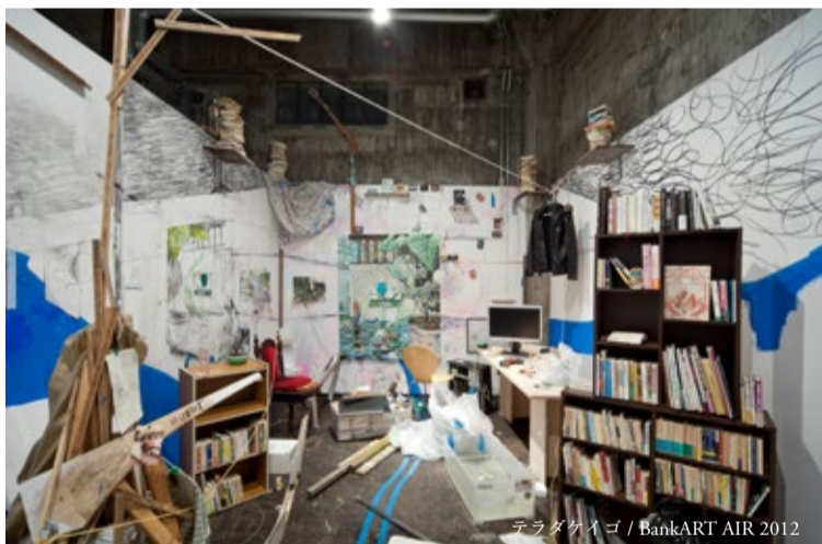
テラダケイゴ / BankART AIR 2012

通常は 展覧会・イベント会場の BankART Studio NYKが、4月～6月、クリエイターの制作スタジオとして変身します。全国から集まったアーティストの生き生きとした制作現場をご覧になり、交流していただければと思います。皆様のご来場をお待ちしております。