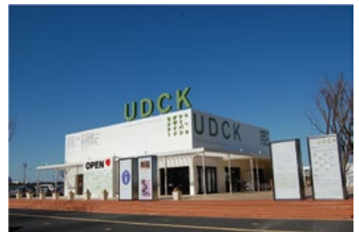
柏の葉アーバンデザインセンター