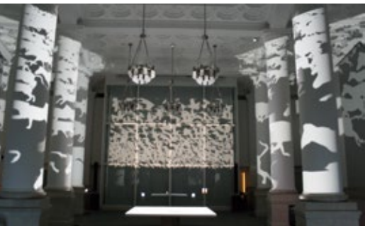
「アフリカ希望の大地展」2008@BankART1929 Yokohama (横浜)