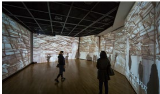
「都市に棲む~BankART1929のアクティビティ」2015@光州市立美術館 (光州・韓国)