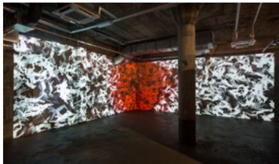
《HINOMARU》Video Installation / 2015 / 8min 「アートと都市を巡る横浜・台北」2015@BankART Studio NYK (横浜)