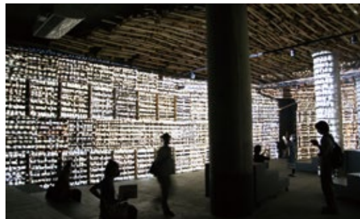
《a world》Video Installation / 2010 / 5min 「BankART Life4 東アジアの夢」2014@BankART Studio NYK (横浜)