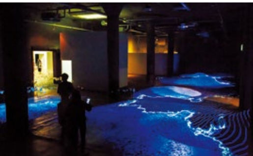
《The Fictional Island》Video Installation / 2016 / 20min 「BankART Life 5 観光」2017@BankART Studio NYK (横浜)

道路に面したBankART SILKのガラス張りの空間で高橋氏の映像アーカイブと新作がどのように昇華していくのかを見届けたいと思います。