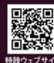
特設ウェブサイト

https://tsukiakari-theater.jp Twitter: mo_on_light_ Instagram: moonlight_mobile_theater Facebook: tsukiakari.theater