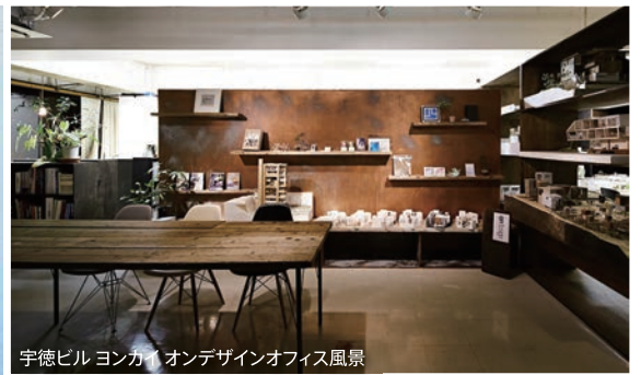
宇徳ビル ヨンカイ オンデザインオフィス風景