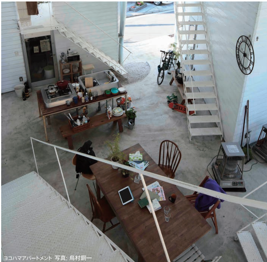
ヨコハマアパートメント