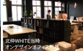
北仲WHITE当時 オンデザインオフィス風景