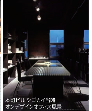
本町ビル シンゴカイ当時 オンデザインオフィス風景