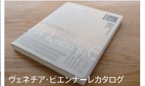
ヴェネチア・ビエンナーレカタログ