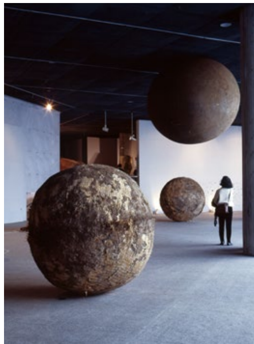
Ground Transposition -139°52'09" 36°33'52" (1987), Tochigi Prefectural Museum of Fine Art, Tochigi