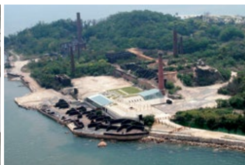
INUJIMA ART PROJECT (1995-), Okayama