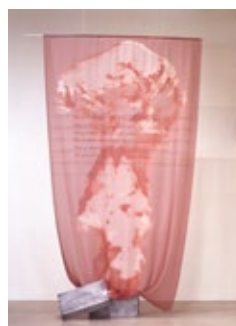
The Forbidden Box (1995) The Queens Museum of Art, New York

お問合せ | info@islandjapan.com / 070-6585-8960(伊藤)