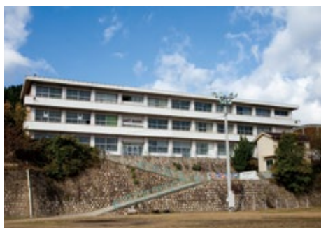
ART BASE MOMOSHIMA (2012-), Hiroshima