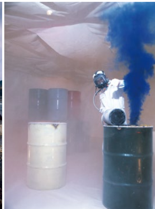
Ground Coloring Project - on the city - (1987), Hillside Gallery, Tokyo