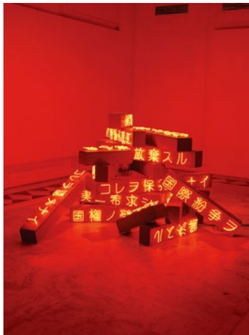
Article 9 (1994), National Gallery of Modern Art, New Delhi