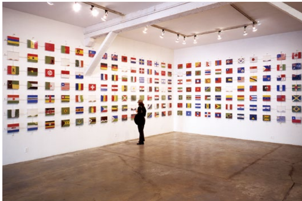
The World Flag Ant Farm (1990), Los Angeles Contemporary Exhibitions, Los Angeles