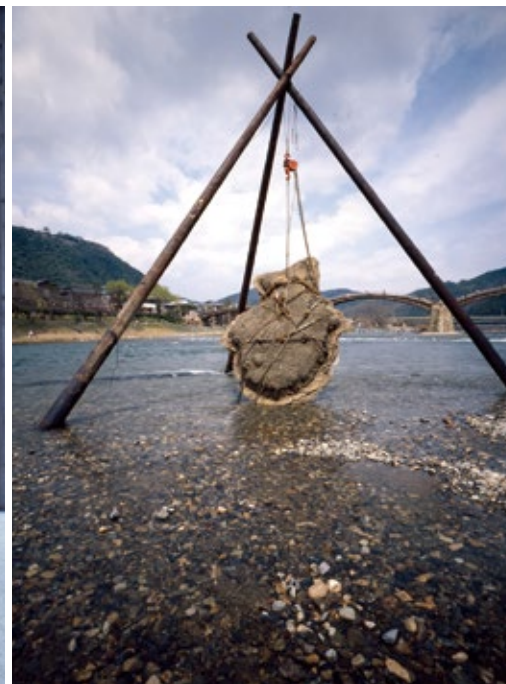
Ground Fish (1988), Iwakuni Outdoor Art Project, Yamaguchi