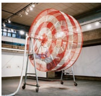
Project: Red, White and Blue - Wandering Position (1990) Yale University Art and Architecture Gallery, Connecticut