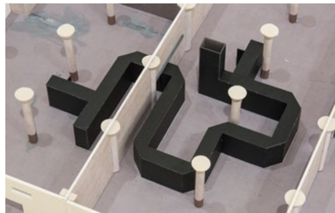
犬島アートプロジェクトコンセプトモデル (BankART Studio NYK 個展のためのプラン) (2016)

カタログ仕様: A4変形、2冊組(箱入り)2,700円(税込) 2冊目はドキュメンテーションにつき、会期終了後送付(送料無料)