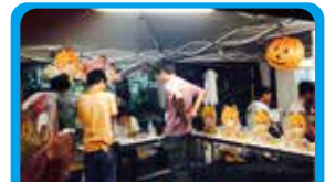
湯河原駅前通り明店街 商店街のキャラクターをPRする商品の試作販売