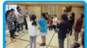
ハッピーサークル テーマ曲づくりとダンスでのイベント盛り上げ