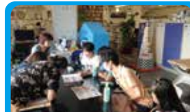
公財)神奈川フィルハーモニー管弦楽団 プロモーションのためのかなフィルLINEスタンプづくり