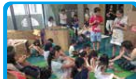
フォーラム・アソシエ 子どもが主体となるイベントの運営