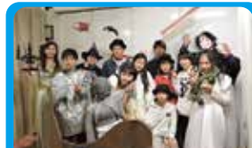
NPO法人街カフェ大倉山ミエル 商店街の歴史を認識してもらうイベント企画