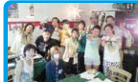
ホットシェフ 商店街のプロモーションビデオ撮影