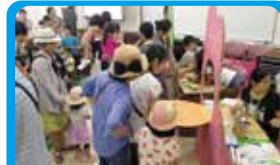
ほどがやこどもニコニコフェスタ 子どもが主体となるイベントの運営