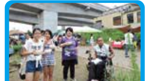
NPO法人横浜移動サービス協議会 バリアフリーマップづくりをこどもたちと