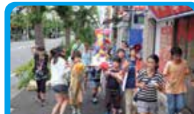
鋼管通商栄会 アツツ交換の商店街イベントを定着させる