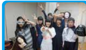
横浜市中川西地区センター 新しい事業寺子屋のPRイベント企画