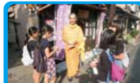
NPO法人夢キューブ ハロウィンイベントの企画とプロモーションビデオ撮影