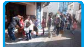
株)三浦海業公社 三崎のまちの魅力を伝えるウォークラリー