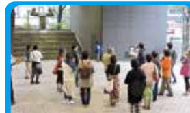
横浜都筑文化プロジェクト 横浜北部エリアの文化的魅力を研究