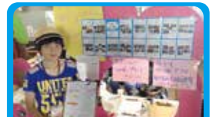
NPO法人横浜コミュニティデザイン・ラボ 環境イベントに来た子ども向けのブース企画