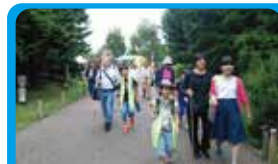
かながわブラインドスキークラブ 視覚障害の方達とのまちあるきとマニュアルづくり